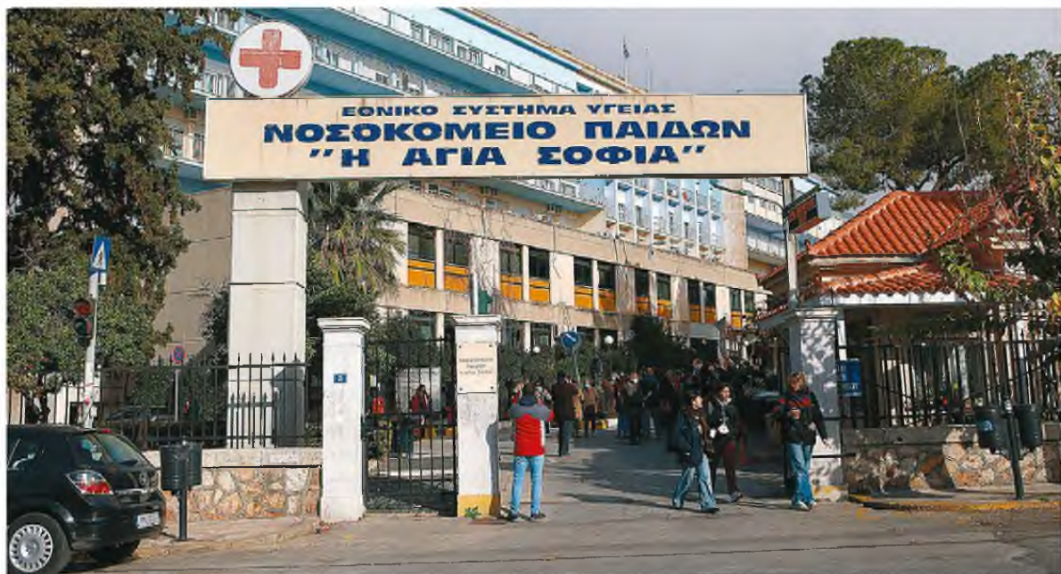
Το κύμα της γρίπης εξασθενεί, ωστόσο οι εργαζόμενοι στα νοσοκομεία μιλούν για ελλείψεις που προκαλούν «έμφραγμα» σε κάθε εφημερία.

Όσον αφορά τον SARS-CoV-2, το στέλεχος BA.5 («Ομικρον 5»), το οποίο καλύπτει και το επικαιροποιημένο εμβόλιο που υπάρχει από το φθινόπωρο στη χώρα μας, εξακολουθεί να είναι το συχνότερα αναγνωριζόμε-