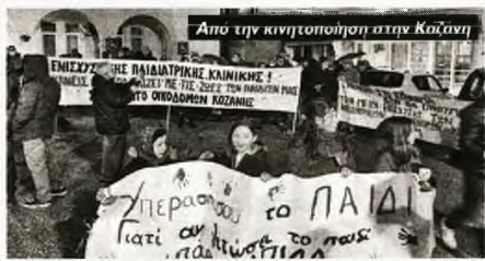
Από την κινητοποίηση στην Κοζάνη

Φωντούν οι κινητοποιήσεις υγειονομικών σε όλη τη χώρα, με τα σωματεία τους να συντονίζουν τη δράση τους με εργατικά σωματεία και άλλους φορείς φέρνοντας στην επιφάνεια τις διεκδικήσεις για ουσιαστική ενίσχυση με μέσα και προσωπικό και καταγγέλλοντας την πολιτική της εμπορευματοποίησης, που απομυνώνει τις δημόσιες μονάδες Υγείας. Στο επίκεντρο βρίσκονται οι διεκδικήσεις για τα παιδιατρικά νοσοκομεία, που «στενάζουν» από τις τραγικές ελλείψεις, με τις απανωτές «διακομιδές» από την περιφέρεια στα αστικά κέντρα και τις ανύπαρκτες ΜΕΘ σε ολόκληρους νομούς να βάζουν σε σοβαρούς κινδύνους τη ζωή των μικρών ασθενών.