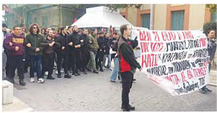
Έξω από το Μουσείο Ηρακλείου, στηρίζοντας τα αιτήματα των εργαζομένων που αντιδρούν στη μετατροπή πέντε μουσείων, μεταξύ των οποίων και του Αρχαιολογικού Μουσείου Ηρακλείου, σε ΝΠΔΔ, βρέθηκαν υγειονομικοί και εκπρόσωποι σωματείων εργαζομένων.