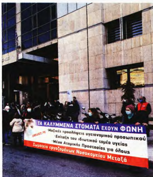
Πάνω, συγγιότυπο από παλαιότερη συγκέντρωση εργαζομένων στο νοσοκομείο «Ευαγγελισμός». Η κατάσταση με τις ελλείψεις προσωπικού και τα ανεπαρκή μέτρα προστασίας ασθενών και εργαζομένων έχει γίνει πλέον σφόδρα. Αριστερά, αντίστοιχη πορεία διαμαρτυρίας των εργαζομένων στα νοσοκομεία «Θριάσιο», «Αττικών» και Νίκαιας στα γραφεία διοίκησης της 2ης ΥΠΕ

το οποίο πλημμύριζε και πλημμυρίζει σε κάθε γενική εφημερία του. «Είναι επανάληψη του ίδιου έργου», μας λέει ο γγ. της ΟΕΝΓΕ, «θέλουν όπως και στις μεγάλες οξύνσεις της πανδημίας να ξεφορτώσουν κάποια περιστατικά, αντί να προχωρήσουν σε ουσιαστικές κινήσεις όπως είναι οι προσλήψεις μόνιμου προσωπικού και το άνοιγμα των νοσοκομείων