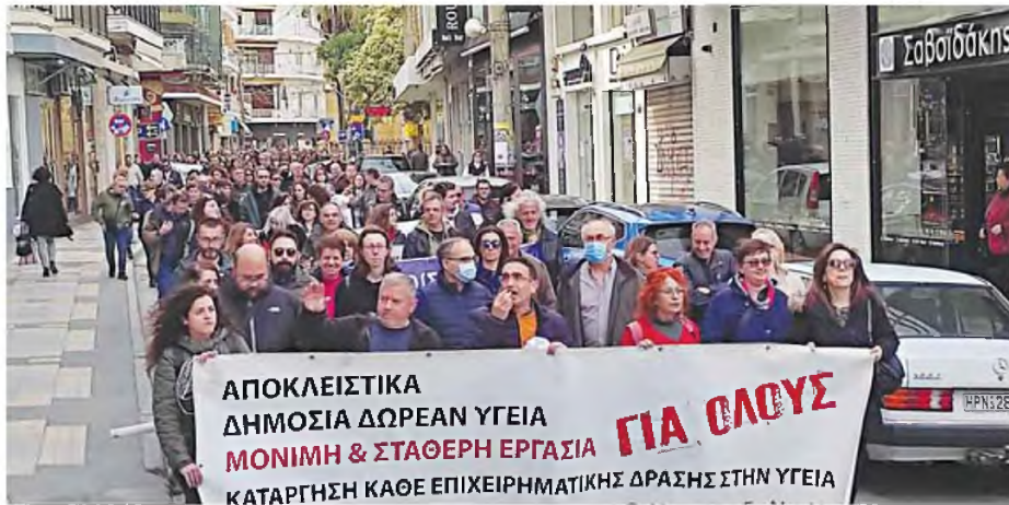
Υγειονομικοί και φορείς απ' όλο το νησί χθες συμμετείχαν στο συλλαλητήριο στην πλατεία Ελευθερίας, ενώ πραγματοποιήσαν πορεία διαμαρτυρίας στους δρόμους του Ηρακλείου.