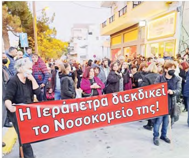
Εκτός από το συλλαλητήριο στην πλατεία Ηρώων, οι διαδηλωτές θα κάνουν πορεία με πανό και συν- θήματα μέχρι το νοσοκομείο, όπου θα πιαστούν χέρι-χέρι και θα δημιουργήσουν μια ανθρώπινη αλυ- σίδα γύρω από αυτό.

■ Κλειστά καταστήματα και υπηρεσίες για το μεγάλο συλλαλητήριο ενάντια στην υποβάθμιση του νοσοκομείου της πόλης - Στις 11 το πρωί στην πλατεία Ηρώων το αγωνιστικό ραντεβού