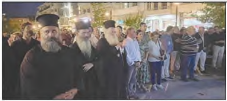
“Κλείνει” σήμερα η Ιεράπετρα για να μπορέσει να συμμετέχει ο κόσμος στο μεγάλο συλλαλητήριο