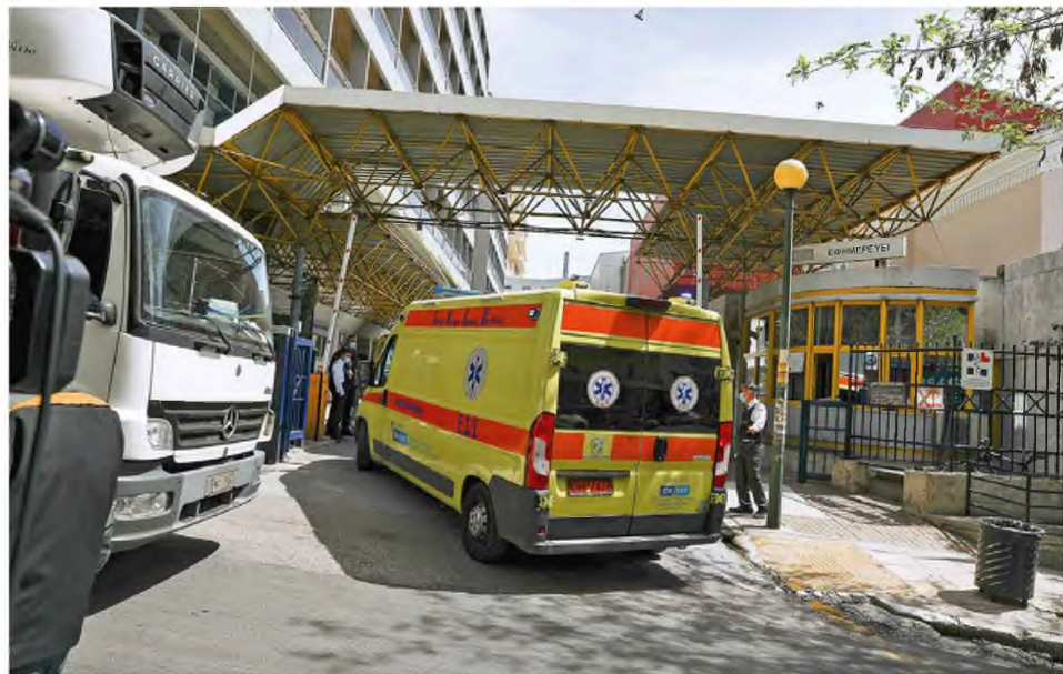
Στην περίπτωση του «Ευαγγελισμού» (φωτ.) προβλέπεται η επικουρήσή του από το ΝΙΜΤΣ, το οποίο θα νοσηλεύει 27-30 ασθενείς που έκαναν εισαγωγή στον «Ευαγγελισμό» ανά εφημερία και θα δέχεται 40-50 περιστατικά που διακομίζονται μέσω του ΕΚΑΒ και τα οποία απευθύνονταν στον «Ευαγγελισμό».

Στην προσπάθεια παρακολούθησης του εφημεριακού έργου στο ΕΣΥ και στη βελτιστοποίηση του συστήματος των εφημεριών, το «Φιλόλαος» είναι πολυεργαλείο για το Κέντρο Επιχειρήσεων του