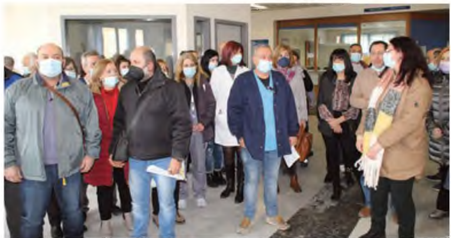
Από την κινητοποίηση των εργαζομένων.

» Ζητούν μονιμοποίηση των απασχολούμενων με ειδικό πρόγραμμα και μισθολογική αναβάθμιση