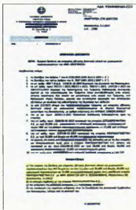
Το έγγραφο του «Θεαγένειο» για την ανάθεση έργου στο ιδιωτικό εργαστήριο

Η απόφαση (9.2.2023) της διοίκησης του Αντικαρκινικού Νοσοκομείου Θεσσαλονίκης «Θεαγένειο» να παραχωρήσει μέρος του έργου του Παθολογοανατομικού Εργαστηρίου σε ιδιωτικό εργαστήριο, λόγω της έλλειψης ιατρών παθολογοανατόμων, είναι χαρακτηριστική. Με απόφασή της η διοικήτρια Ευαγγελία Κουρτέλη - Ξουρή αναθέτει σε ιδιωτικό εργαστήριο τις εξετάσεις «βιοψτικού υλικού και χειρουργικών παρασκευασμάτων έως 400 δειγμάτων για έναν (1) μήνα, τιμή 30,00 ευρώ ανά βιοψία, 60,00 ευρώ ανά χειρουργικό παρασκεύασμα και 15,00 ευρώ για ανοσοϊστοχημική χρώση».