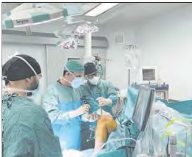
Σε απόγνωση ασθενείς που περιμένουν μέρες να χειρουργηθούν στην Ορθοπεδική Κλινική του ΠΑΓΝΗ