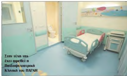
Στην τύχη της έχει αφαιρεθεί η Παιδοψυχιατρική Κλινική του ΠΑΓΝΗ

Χωρίς εφημερίες θα είναι από τον επόμενο μήνα η Παιδοψυχιατρική Κλινική του ΠΑΓΝΗ, η μοναδική που υπάρχει στην Κρήτη, γιατί δεν θα υπάρχει παιδοψυχίατρος να εφημερεύει.