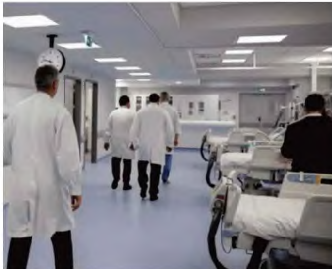
Θέμα χρόνου οι υπουργικές αποφάσεις - Συνεχίζεται η επεξεργασία για την αναμόρφωση του ΕΣΥ και τον Χάρτη Υγείας

νούς από την περιοχή που βρίσκεται στις δομές υγείας, ώστε να έχει μια σωστή και πλήρη υγειονομική κάλυψη και περίθαλψη. Στόχος του Χάρτη Υγείας είναι η διασύνδεση των νοσοκομείων ή των υγειονομικών δομών με βάση συγκεκριμένα κριτήρια,