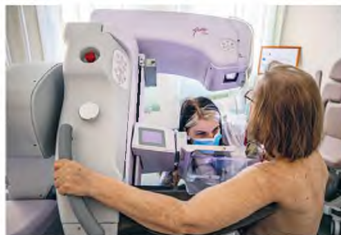
Σε κλινική της Βουδαπέστης, μετά τη μαστογραφία ακτινολόγοι ελέγχουν την απεικόνιση για σημάδια νεοπλασιών και στη συνέχεια το λογισμικό AI επισημαίνει τυχόν περιοχές για περαιτέρω διερεύνηση.

Το λογισμικό λειτουργεί καλύτερα σε συνδυασμό με τους γιατρούς, όπως έχει αποφανθεί και το εθνικό σύστημα υγείας της Σκωτίας, το οποίο θα το υιοθετήσει παράλληλα με συμβατικές μαστογραφίες σε έξι κλινικές. Το αμερικανικό Εθνικό Αντικαρκινικό Κέντρο εκτιμά ότι ποσοστό 20% των καρκίνων του μαστού δεν εντοπίζονται από μαστογραφίες. Η καθηγήτρια Πυρρικής Ιατρικής της ιατρικής σχολής του Πανεπιστημίου Χάρβαρντ, Κόνσταντ Λίμαν, καλεί τους γιατρούς να διατηρούν ανοικτό μυαλό απέναντι στην AI: «Δεν είμαστε περιττοί, αλλά υπάρχουν λειτουργίες που γίνονται καλύτερα από υπολογιστές».