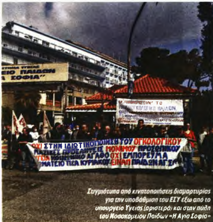
Σταγμιότυπα από κινητοποιήσεις διαμαρτυρίας για την υποβάθμιση του ΕΣΥ έξω από το υπουργείο Υγείας (αριστερά) και στην πύλη του Νοσοκομείου Παιδών «Η Αγία Σοφία»

δουλεύουμε σε άκρως επι-σφαλείς συνθήκες, τόσο για εμάς όσο και για τους ασθενείς μας. Κι ας έχουμε προειδοποιήσει πολλές φορές για τους κινδύνους που υπάρχουν...», προσθέτουν.