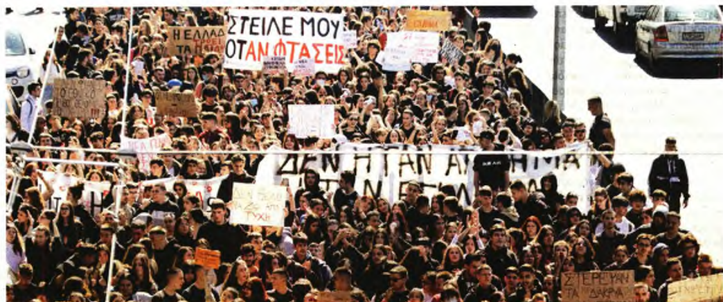
Το έγκλημα αυτό δεν θα συγκαλυφθεί

Στον απόηχο του τραγικού σιδηροδρομικού δυστυχήματος, η ΑΔΕΔΥ καλεί τους δημοσious υπαλλήλους να συμμετάσχουν στην 24ωρη απεργία στον δημόσιο τομέα ώστε να μπει τέρμα στην πολιτική των ιδιωτικοποιήσεων και να αποδοθούν οι πραγματικές ευθύνες για το δολοφονικό εγκλημα. Χαρακτηριστική είναι και η ανακοίνωση του Εργατικού Κέντρου Αθηνών (ΕΚΑ) που μεταξύ άλλων αναφέρει ότι οι εργαζόμενοι διεκδικούν την άμεση λήψη μέτρων ασφαλείας σε όλες τις γραμμές σταθερής τροχιάς του πανελλαδικού και αστικού σιδηροδρομικού δικτύου (ΟΣΕ-ΣΤΑΣΥ-ΤΡΑΜ), καθώς και σε όλα τα αστικά δίκτυα μεταφορών προσώπων (ΟΑΣΑ,