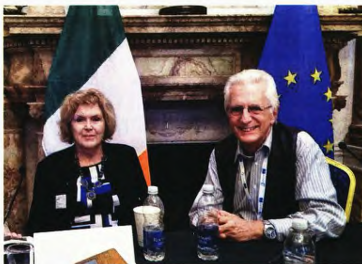
Η ειδική εισηγήτρια του ΟΗΕ για την Κατάσταση των Υπερασπιστών Ανθρωπίνων Δικαιωμάτων, Μαίρη Λόλορ, με τον διευθυντή της ΜΚΟ «Ελληνικό Παρατηρητήριο των Συμφωνιών του Ελσίνκι» Παναγιώτη Δημητρά

Στην επιστολή της προς την ελληνική κυβέρνηση στις 28 Δεκεμβρίου, από κοινού