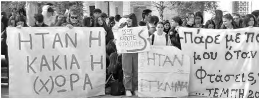
Συνέχεια στη σελίδα 6