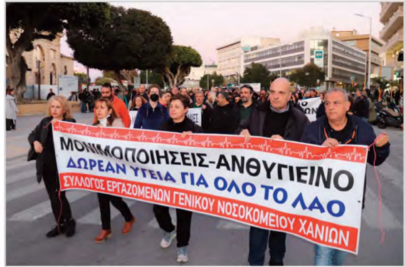
Συγκέντρωση και πορεία, για τη στήριξη του ΕΣΥ και του Νοσοκομείου Χανίων «χες το απόγευμα στα Χανιά».

«Μην ακούτε κανένα ότι το Νοσοκομείο μας έχει στελεχωθεί με προσωπικό είναι ένα μεγάλο ψέμα. Οι γιατροί και το νοσηλευτικό προσωπικό που έχει απομείνει έχει εξουθενωθεί μετά και την πανδημία. Η ασφαλής εφημέρευση για πάρα πολλές κλινικές του νοσοκομείου (παθολογικές, χειρουργικές, ορθοπαιδική) έχει καταργηθεί εδώ και καιρό. Όλοι οι νέοι συνάδελφοι φεύγουν στο εξωτερικό, ένα απίστευτο κόστος που θα το βρούμε μπροστά μας»