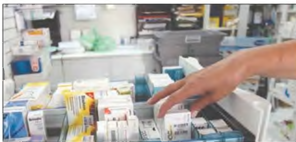
Νέο σύστημα στις αγορές και τις προμήθειες

Σύμφωνα με τον υπουργό Υγείας Θάνο Πλεύρη, το νέο μοντέλο πληρωμών θα είναι απλοποιημένο, αφού όλες οι παραγγελίες στα νοσοκομεία θα γίνονται μέσω της ΕΚΑΠΥ. Μέσω της Αρχής, θα συμβάλλονται όλες οι φαρμακευτικές εταιρείες ώστε να μπορούν και να παρέχουν τα φάρμακά τους στο σύστημα υγείας.