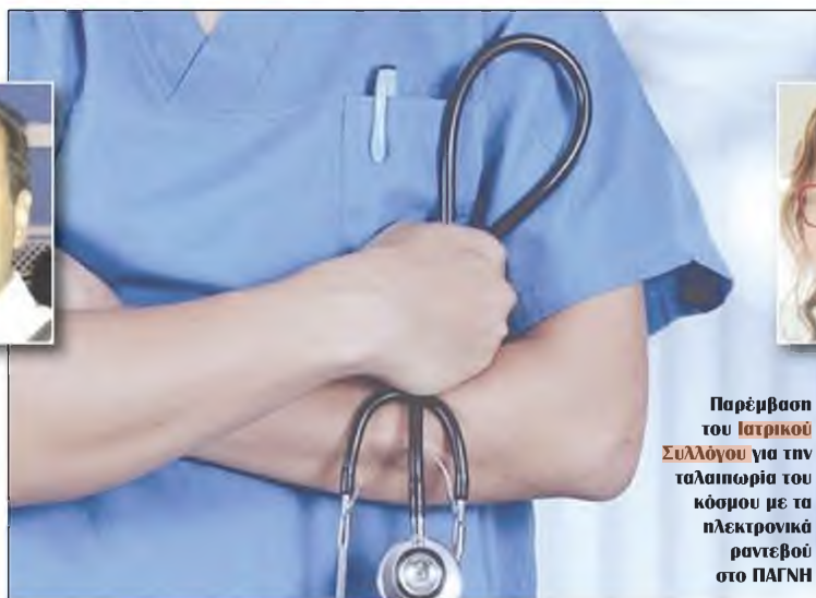
Παρέμβαση του Ιατρικού Συλλόγου για την ταλαιπωρία του κόσμου με τα ηλεκτρονικά ραντεβού στο ΠΑΓΝΗ

τικές τομογραφίες, αλλά και για ραντεβού με γιατρούς διάφορων ειδικοτήτων όπως είναι οι ενδοκρινολόγοι, οι καρδιολόγοι, οι οφθαλμίατροι.