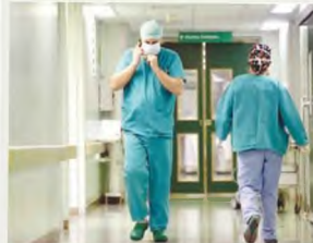
Τεράστια τα κενά θέσεων στα νοσοκομεία

Σταγόνα στον ωκεανό των ελλείψεων χαρακτηρίζουν τις προκηρξίες 59 θέσεων στα νοσοκομεία της Κρήτης οι Ενώσεις Νοσοκομειακών Γιατρών και εκπρόσωποι Ιατρικών Συλλόγων.