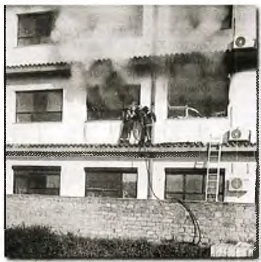
Από την πυρκαγιά πέρυσι

Σ ε λίγες μέρες, στις 6 Απρίλη, κλείνει ένας χρόνος από τη μέρα που η Πνευμονολογική κλινική του Νοσοκομείου «Γ. Παπανικολάου» κήκε, αφήνοντας πίσω της δύο νεκρούς και την υπόσχεση του υπουργού Υγείας ότι «σε μια βδομάδα θα επαναλειτουργήσει».