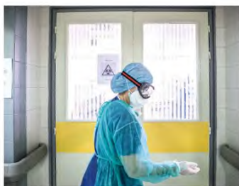
Κατά τη διάρκεια της πανδημίας η αύξηση εργαζομένων προήλθε σχεδόν εξ ολοκλήρου από προσλήψεις προσωπικού ορισμένου χρόνου.