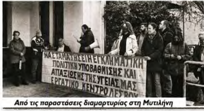
Από τις παραστάσεις διαμαρτυρίας στη Μυτιλήνη

Σ ε κινητοποίηση αύριο Πέμπτη, στις 12 μ., στο υπουργείο Υγείας προχωρά το Εργατικό Κέντρο Λαυρίου - Ανατολικής Αττικής, διεκδικώντας να ενισχυθεί το Κέντρο Υγείας Λαυρίου, να στελεχωθεί με όλες τις ειδικότητες, με μόνιμο και σταθερό ιατρικό και νοσηλευτικό προσωπικό. Για τη συμμετοχή στην κινητοποίηση θα αναχωρήσει λεωφορείο στις 9.30 π.μ. από το Λαύριο (ΟΤΕ).