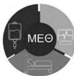
Μονάδα Εντατικής Θεραπείας Γ.Ν.Κοζάνης

Εντυπωσιακός ο εξοπλισμός της ΜΕΘ από δωρεές. Λειτουργούν 4 κλίνες και εάν υπήρχε προσωπικό θα μπορούσαν να λειτουργούν 8 κλίνες που είναι υπερπαραίτητες για τη Δυτική Μακεδονία. Με βάση τα διεθνή Στάνταρτ οι κλίνες ΜΕΘ θα πρέπει να είναι το 10% των νοσοκομειακών κλινών. Στη χώρα μας με 35.000 νοσοκομειακά κρεβάτια θα πρέπει να λειτουργούν 3.500 κλίνες ΜΕΘ. Με βάση την πρόσφατη εγκύκλιο της Αν. Υπουργού Υγείας οι πολυδύναμες ΜΕΘ θα πρέπει να είναι σε ποσοστό 5% των νοσοκομειακών κλινών. Δηλαδή στη χώρα μας θα πρέπει να λειτουργούν 1.750 κλίνες ΜΕΘ πλήρως εξοπλισμένες και στελεχωμένες με προσωπικό όπως προβλέπει η εγκύκλιος. Και όμως. Στη χώρα μας μετά τρία χρόνια πανδημίας λειτουργούν στα νοσοκομεία 950 κλίνες ΜΕΘ.