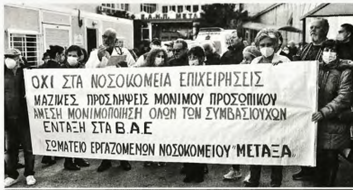
Από πρόσφατη κινητοποίηση εργαζομένων του Νοσοκομείου

Όταν οι καταγγελίες των ασθενών για τη δραματική υποχρηματοδότηση των νοσοκομείων, τις τραγικές ελλείψεις σε προ-