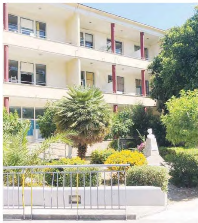
Μιλώντας στη “Νέα Κρήτη” και την “ΚΡΗΤΗ TV”, εκπρόσωποι των υγειονομικών περιέγραψαν δραματικές καταστάσεις εξαιτίας της υποστελέχωσης και της υπερεφημέρευσης του ιατρικού προσωπικού με τη συνεπακόλουθη εξουθένωσή του, ενώ κρούουν το “καμπανάκι” του κινδύνου για τα όσα έρχονται...

Άξιο αναφοράς είναι το γεγονός ότι, σύμφωνα με τον κ. Φλυτζάνη, υπάρχει πρόβλημα και με τη νοσηλευτική υπηρεσία του νοσοκομείου , καθώς σε σχέση με ένα χρόνο πριν, το προσωπικό είναι μειωμένο κατά 35 άτομα!