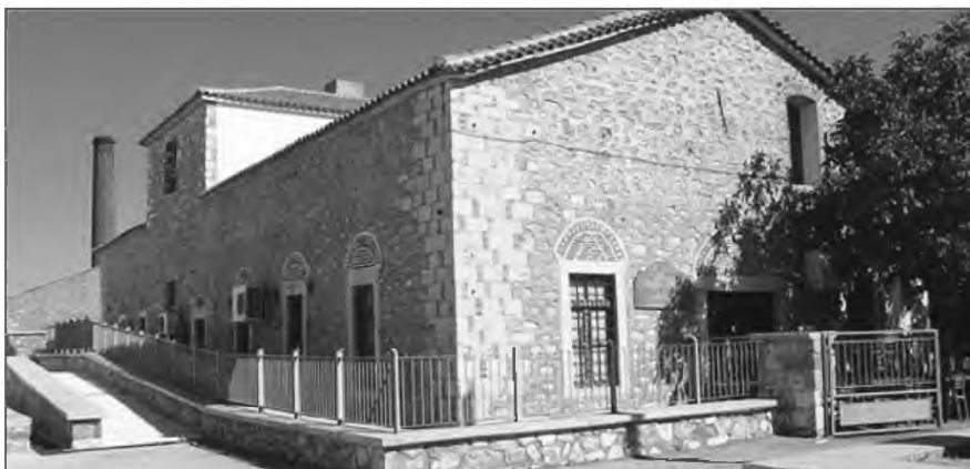
Το Πολυδύναμο Περιφερειακό Ιατρείο Αγιάσου