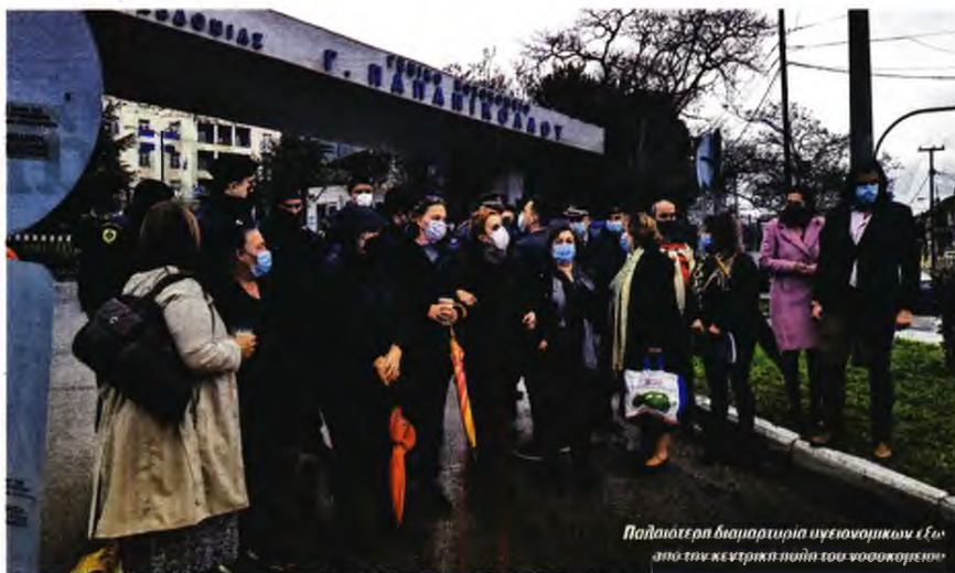
Παλαιότερη διαμαρτυρία υγειονομικών έξω από την κεντρική πύλη του νοσοκομείου

»Στο άλλο καμάρι, την Καρδιοχειρουργική (κλινική στην οποία