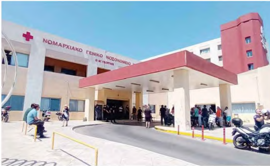
Χθες το μεσημέρι, στο αμφιθέατρο του νοσηλευτικού ιδρύματος, παρουσία των εκπροσώπων του κληροδοτήματος, υπεγράφη η σύμβαση με τον ανάδοχο και το αμέσως επόμενο διάστημα αναμένεται να αρχίσουν οι εργασίες.