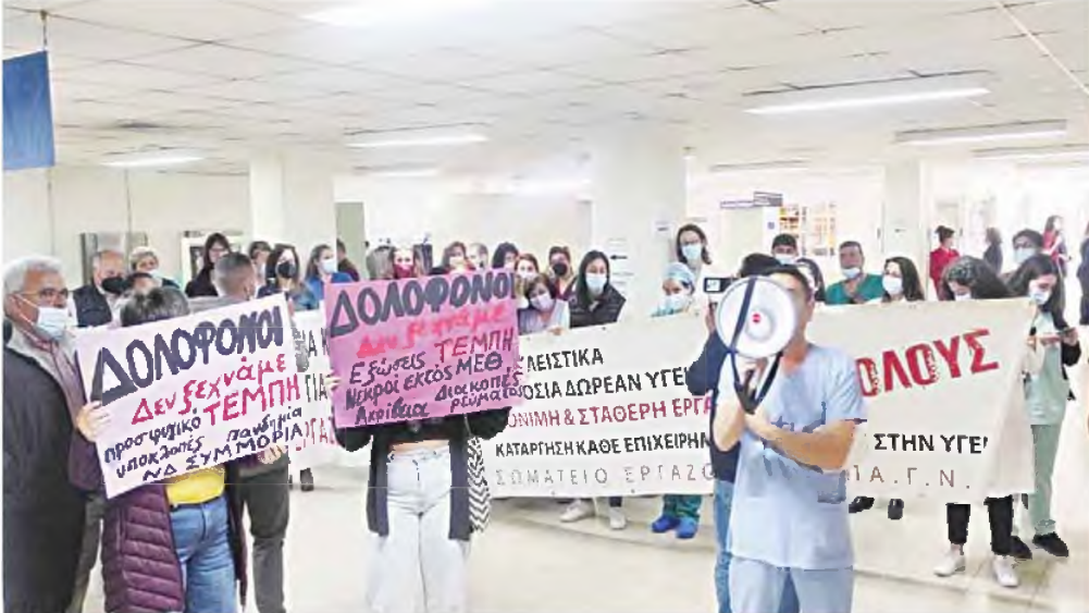
Σε νέες συγκρούσεις - σύμφωνα με τη σχετική καταγγελία του Σωματίου Εργαζομένων του ΠΑΓΝΗ - οδηγεί τις σχέσεις εργαζομένων και διοίκησης μία ομόφωνη απόφαση της διοίκησης του Πανεπιστημιακού Νοσοκομείου, με την οποία το προεδρείο των εργαζομένων καλείται σε συζήτηση σχετικά με... τον τρόπο των κινητοποιήσεων, «ώστε να διαφυλάσσεται η ηρεμία και η ασφάλεια των ασθενών»...

■ Το έγγραφο για... ήρεμες κινητοποιήσεις έφερε αντιδράσεις στο ΠΑΓΝΗ