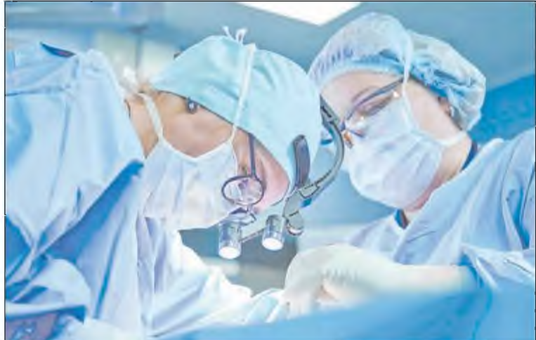
Στο "κόκκινο" τα χειρουργεία ελλείψει αναισθησιολόγων