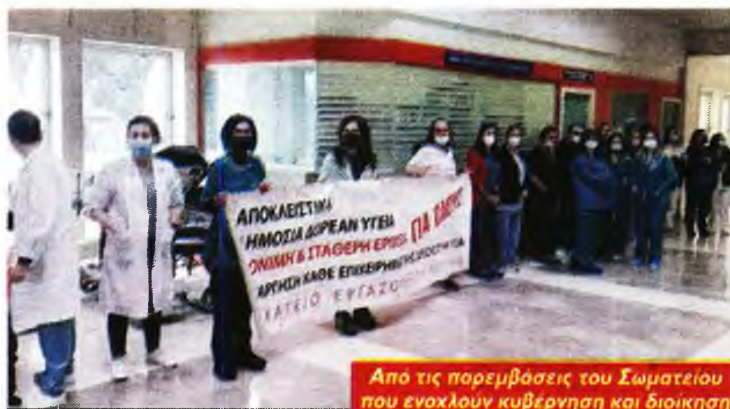
Από τις παρεμβάσεις του Σωματείου που ενοχλούν κυβέρνηση και διοίκηση

«Εμείς οι μαχόμενοι υγειονομικοί που και στα χρόνια της πανδημίας υπηρετήσαμε και συνεχίζουμε να υπηρετούμε τους ασθενείς και διεκδικούμε τη βελτίωση των παροχών Υγείας και των συνθηκών εργασίας, δεν δεχόμαστε μαθήματα για τον τρόπο που θα διεκδικούμε,