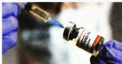
* Φιαλίδιο με τη δραστική ουσία κατά της Covid-19

Παρενέργειες της ουσίας κατά της Covid-19 στην ηλικιακή ομάδα 30-49 ετών (35 οι αναφορές)