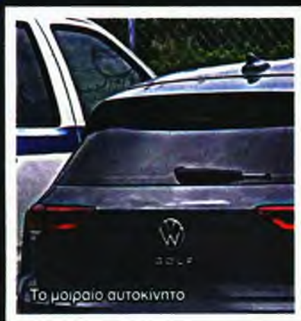
Το μοιραίο αυτοκίνητο