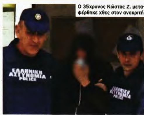
Ο 35χρονος Κώστας Ζ. μεταφέρθηκε χθες στον ανακριτή.

του Σαββάτου θα γίνει στο χωριό Περδικοράχη, τόπο καταγωγής της μητέρας του παιδιού, η κηδεία του. Λίγο πριν από την τελετή, το άτυχο βρέφος θα λάβει με μία ευχή το όνομα Λυδία-Ελένη, σύμφωνα με το πρωτόκολλο της Ακολουθίας των Αγίων Νηπίων.