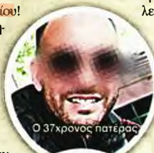
Ο 37χρονος πατέρας