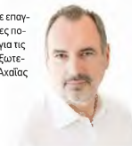
Ο υφυπουργός Α.Κατσανιώτης

Σειρά επαφών και συναντήσεων με επαγγελματίες και κοινωνικές ομάδες πολιτών της Αχαΐας προγραμματίζει για τις επόμενες μέρες ο υφυπουργός Εξωτερικών και υποψήφιος βουλευτής Αχαΐας της ΝΔ, Ανδρέας Κατσανιώτης. Συγκεκριμένα: Περιοδεία στην περιοχή των Καλαβρύτων για το προσεχές Σάββατο 13 Μαΐου, ενώ την Κυριακή 14 Μαΐου (ώρα 11.30 π.μ.) θα μιλήσει στο κατάστημα «Πεύκα» στην Κάτω Αχαΐα, όπου απευθυνόμενος στους πολίτες της Δυτικής Αχαΐας θα αναφερθεί, μεταξύ άλλων, σε θέματα που αφορούν στον αγροδιατροφικό τομέα. Την Δευτέρα 15 Μαΐου (7 π.μ.) ο κ. Κατσανιώτης θα μιλήσει σε πολίτες του Αγίου, σε συγκέντρωση που διοργανώνει στο Πολιτιστικό Κέντρο «Αλέκος Μεγάρης».