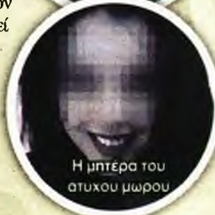
Η μητέρα του άτυχου μωρού